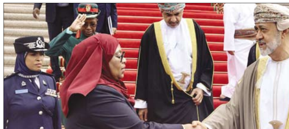
Mama Samia hälsar på Sultan Haitham bin Tarik under statsbesöket i Oman.

Men besöket resulterade också i många andra överenskommelser om samarbete inom sektorer som energi, turism, naturtillgångar och utbildning. 15/6 Daily News