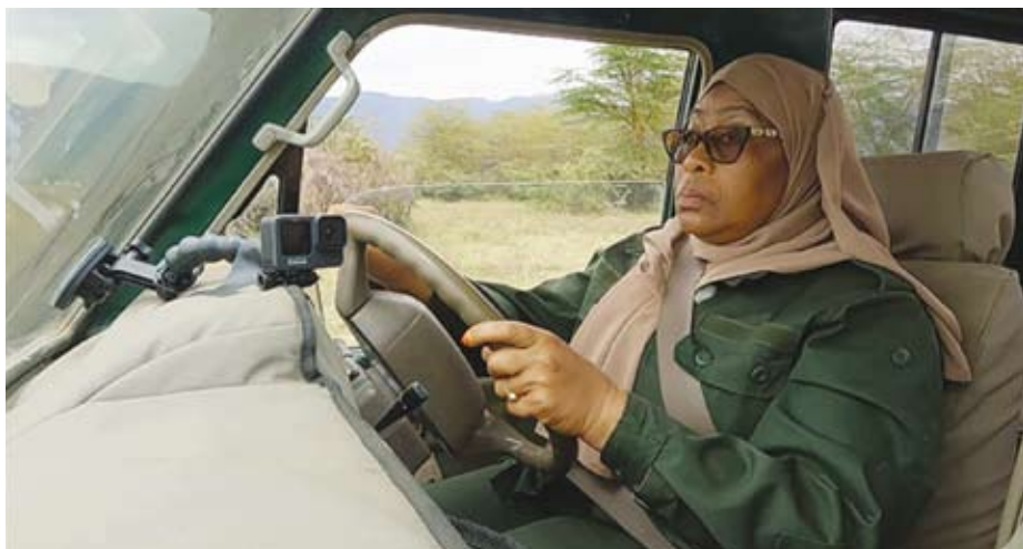
Mama Samia i landrover under en safari i videon The Royal Tour .

Ordförande Lipumba för oppositionspartiet CUF tror att Mama Samia har goda chan-