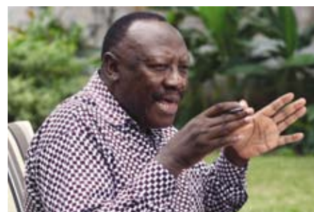
Professor Lipumba, ordförande för oppositionspartiet CUF, tror att Mama Samia kan fortsätta som president efter 2025.

Tanzania exporterade 9000 ton kött till Mellanöstern under det senaste året, för