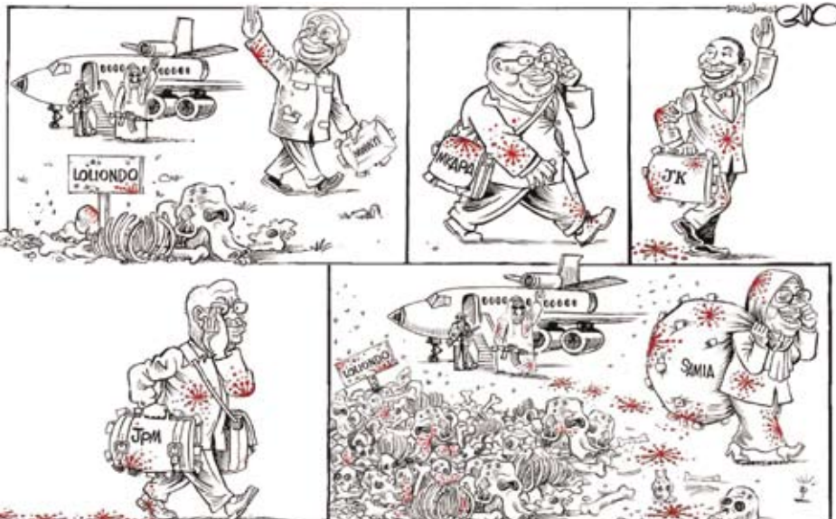
Enligt Gado har alla Tanzanias presidenter sålt jakträtten i Loliondo till rika araber.

Tre av tretton patienter har dött av en tidigare okänd näsblödarsjuka i Lindi. Enligt statsläkare Sichwale har patienterna testat negativt för Ebola, Marburg och Coronavirus. 13/7 Daily News