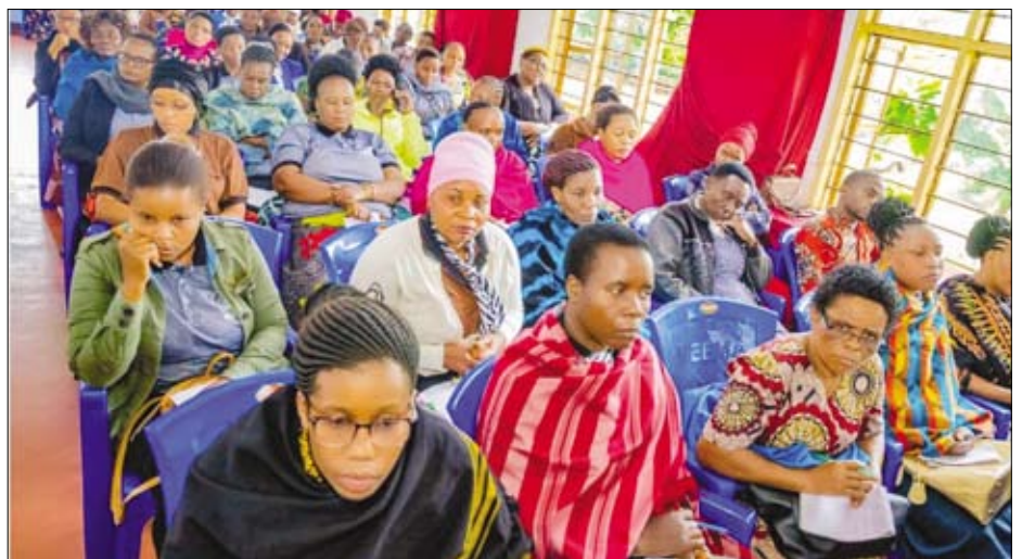
Kursdeltagare i en fortbildningskurs, i klassrummet och i arbete med att ta fram nytt material.