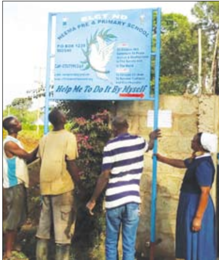
Neema Pre- and Primary School.

i vår skola igen? Barnen i min nya skola vet inte hur man uppför sig. De tar saker ur händerna på en”.