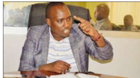
Gruvminister Biteko är nöjd med utvecklingen av småskalig gruvdrift.