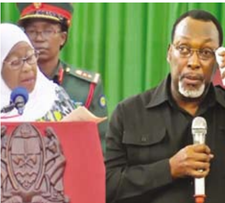
Mama Samia och Chademas ordförande Mbowe efter Mbowes frivgivning.

Mama Samia anser att Afrikanska Utvecklingsbanken borde kunna utfärda SDRs