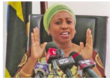
Hälsominister Mwalimu har mycket att stå i: Polio- och Covid-vaccinering, samt den mystiska näsblödarsjukan.