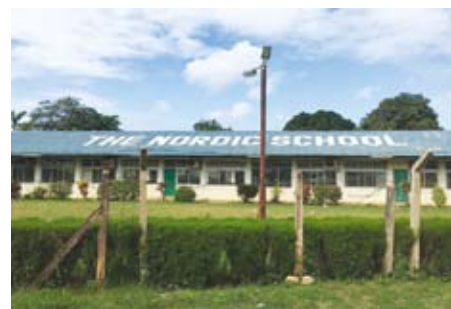
Nordiska Skolan i Dar es Salaam

och får sina inkomster genom skolavgifterna. Föräldrarna får själva se till att barnen kommer till och från skolan och därför försöker de ofta samköra. Språkklasseleverna serveras ett mellanmål, fritidsbarnen får en sen lunch när de anländer och förskolebarnen äter både mellanmål och lunch.