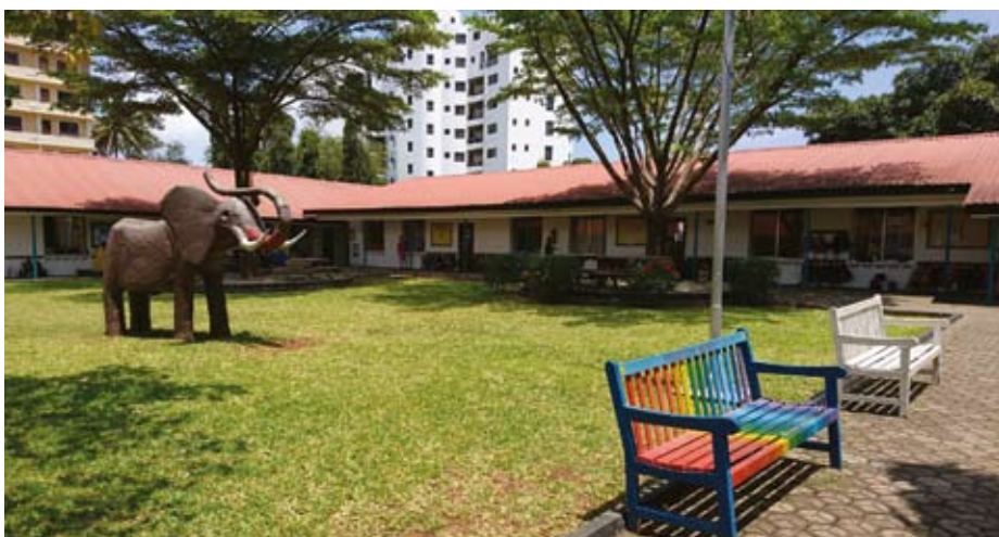
En av IST:s många skolgårdar. På regnbågsbänken står det skrivet Friendship Bench. Det är en av fördelarna med IST att så många nationaliteter får mötas.