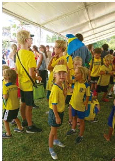
Svenska gruppen vid International Day på Internationella Skolan