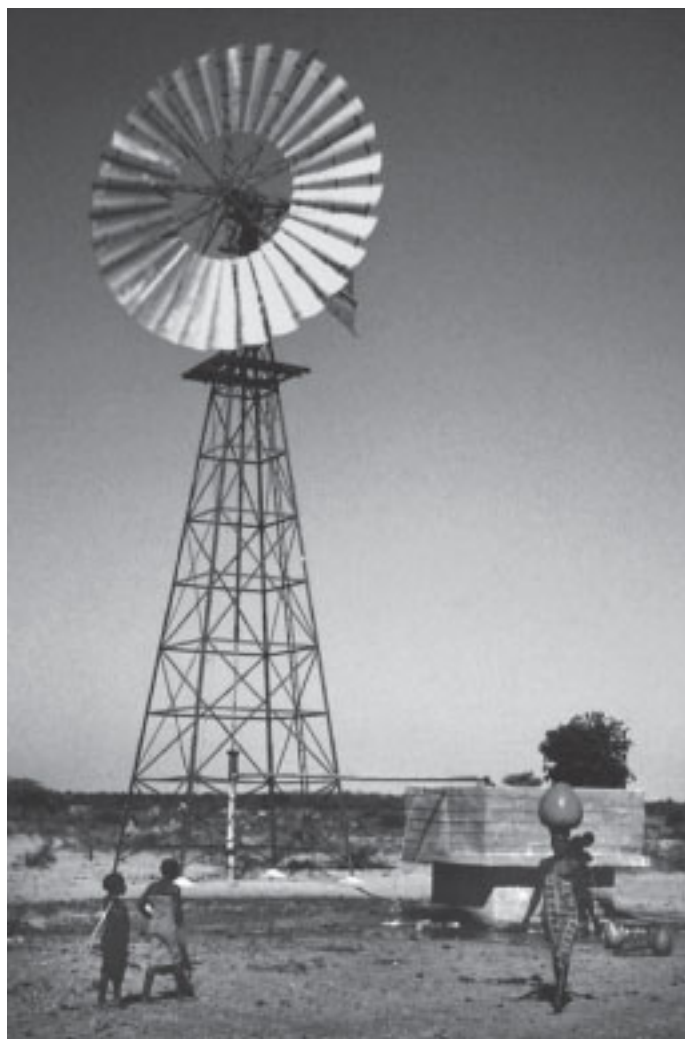
T.v. Julius Kilimos vindsnurra för elproduktion, byggd 2008. T.h. Vindsnurra för vattenpumpning, byggd 1978.