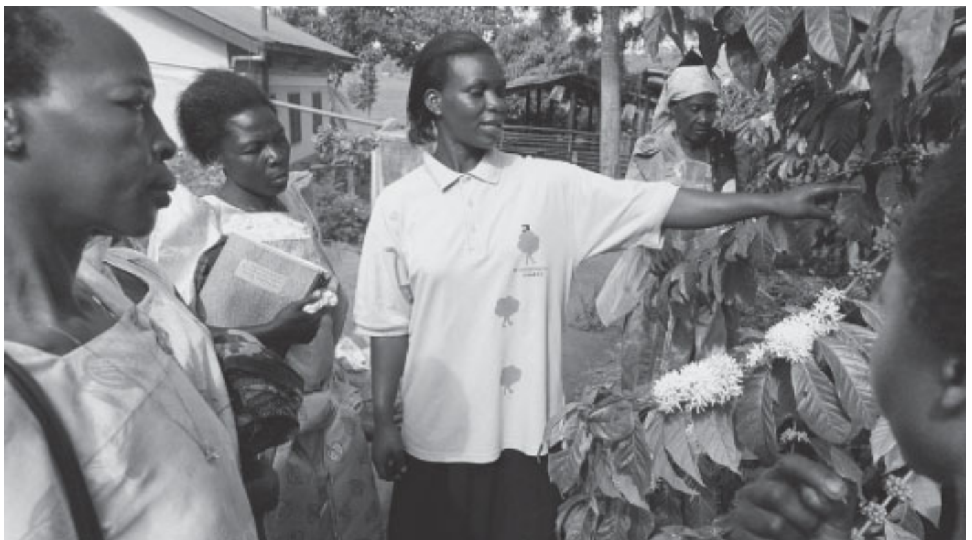
Vi-skogens rådgivare lever och arbetar bland människorna på bynivå.

Redan året efter, 1983, var verksamheten igång i West Pokot i Kenya, ett område som var särskilt hårt drabbat av erosion. Det var inledningen till ett projekt som fortfarande pågår, men som allteftersom resurserna och kunskaperna om odling ökat har kommit att förändras en hel del. I början samarbetade man med en lokal missionsorganisation på plats, medan