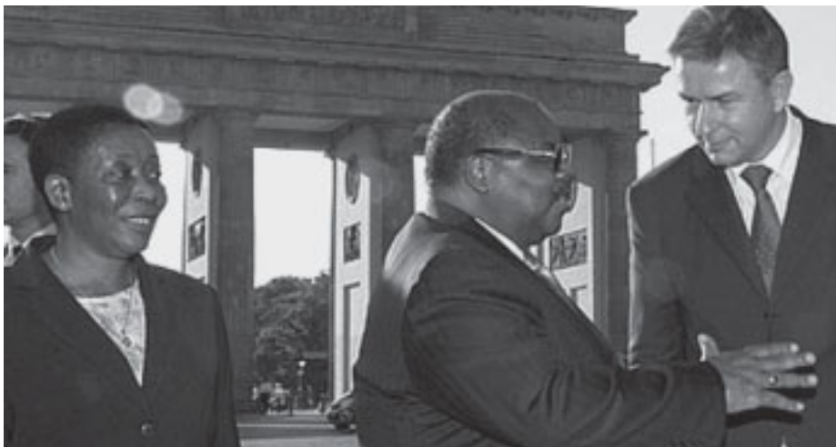
F.d. presidenten Mkapa med sin fru Anna vid ett besök i Berlin – nu har båda problem

8/3 Trycket ökar på fru Mkapa. Anklagelserna om missbruk av tjänsteställning mot före presidenten Mkapa har tagit en ny vändning: Nu vill man undersöka hur hans fru kunnat skapa en stor förmögenhet. Anklagelser mot Anna Mkapa kom först från före presidentens dåvarande finansminister, professor