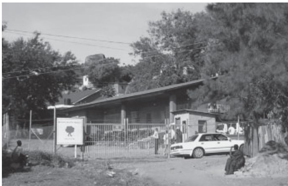
Vi-skogens kontor i Mwanza, Capri Point. Det här var tidigare huvudkontor för HESAWA-projektet som startade 1985 som det reformerade svenska vattenbiståndet, Health Sanitation Water omfattande de tre sjöregionerna. Här finns också tre Ikeamöblerade svenska personalbostäder som bl a inhytt Safinapersonal.

Numera har stiftelsen Vi-skogen en budget på ca 70 miljoner kronor om året. Litet mindre än hälften, ca 27 miljoner