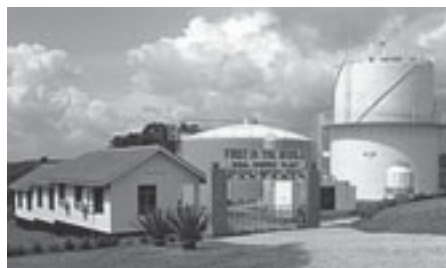
Katanis biogasanläggning i Hale, ett bra exempel på nya klimatsmarta lösningar

sal kan användas som armeringsmaterial inom plastindustrin. Det är främst inom bilindustrin som sisalfiber börjat bakas in i olika plastdetaljer, men även byggindustrin börjar tillämpa liknande teknik, och även pappersindustrin har börjat blanda in sisal i viss pappersmassa. Detta