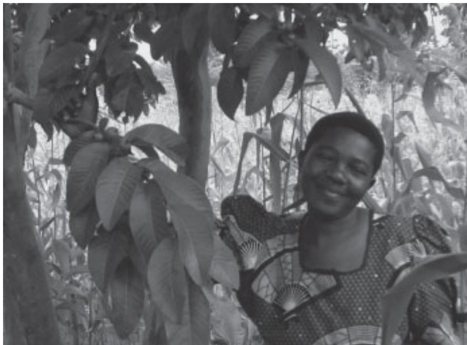
Mama Pesa i en by i Mwanza-regionen, är en av dessa aktiva kvinnor som är engagerade i Vi-skogsprojektet. Hon står vid ett Guavaträd, Mapera på swahili, frukterna är mycket rika på C-vitamin.