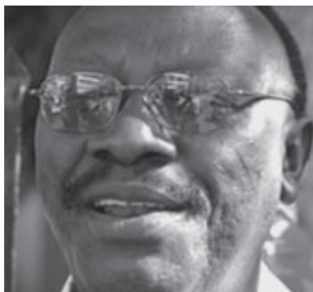
CUFs ordförande Ibrahim Lipumba deltog i kampanjen inför fyllnadsvalet i Mbeya