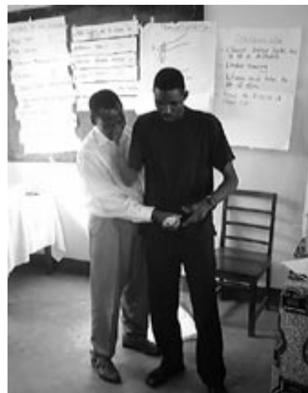
Demonstration av kondompåläggning

Antalet tonårsgraviditeter och sexuella trakasserier har minskat markant i de skolor som omfattas av projektet. De utbildade lärarna säger att de idag har en betydligt bättre relation både till sina elever och deras