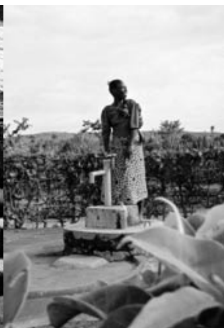
Stegen från vattenhål till grävd brunn med handpump innebär en stor förbättring av livskvaliteten.