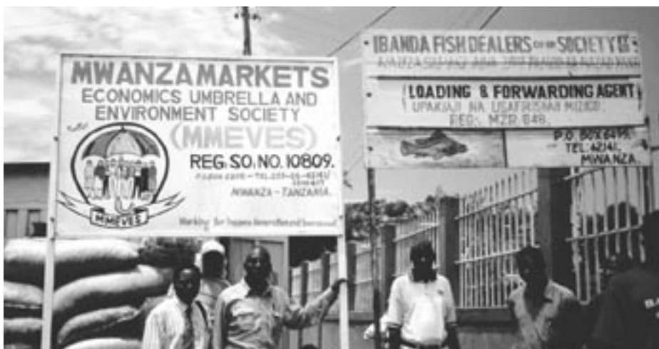
Några exempel på NGO-aktiviteten i Victoria-området: MMEVES och Ibanda Fish dealers.