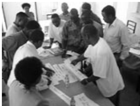
Arbetsmöte i Kondomgruppen

För att nå pojkar/unga män med information utbildade projektet ungdomsinformatörer, lärare och sjukvårdspersonal i Songea, Morogoro, Moshi (Kikati) och Shinyanga.(Maganzo). Men allra först ställde vi en mängd frågor kring sexualitet och jämställdhet till mer än 800 pojkar/unga män. Detta gav oss en bild av vilka attityder och kunskaper som fanns i gruppen och tillsammans med UMATI identifierade vi sedan 14 viktiga teman att prata med unga män om. Dessa har varit grunden för projektet och har sammanställts i en "guidebok". Den kan användas av vuxna som möter unga män med frågor om sexualitet, eller som arbetar med att förändra attityder kring sexualitet och prevention i ungdomsgrupper.