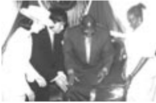
President Mkapa med maka Anna under japanskt statsbesök.