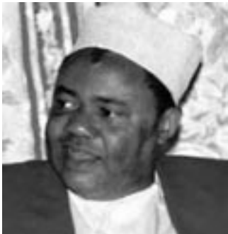
Zanzibars president Salim Amour.

11/1 600 förlorar jobben på Zanzibar. 600 ungdomar på Zanzibar har förlorat sina arbeten som en följd av senaste månadens terroralarm. Många turister packade och lämnade ön och många på väg ställde in sina resor, andra åter sköt upp sina besök till senare. Regeringen har förlorat miljoner på grund av de falska alarmen förklarade en regeringstalesman. (Majira)