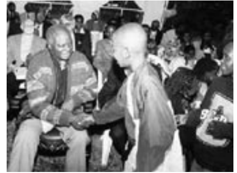
Kenyas president Kibaki - mer attraktiv för biståndsgivarna?

14/2 Privatiseringsförslag dras tillbaka. Regeringen har dragit tillbaka det