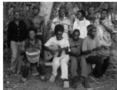
Skolbandet Beachfire i aktion

På söndag eftermiddag var det dags igen för ett nytt försök till styrelsemöte, återigen på Badeco som började bli vana vid våra övningar. Och plötsligt hade vi fem närvarande