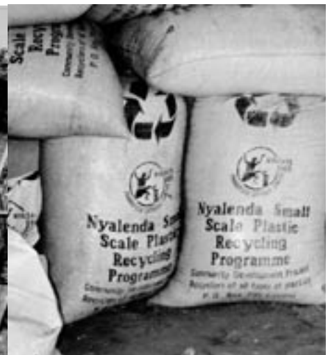
Källsortering och återvinning av plast är viktigt även i utvecklingsländerna. Aktiviteterna pågår i Victoria-området.