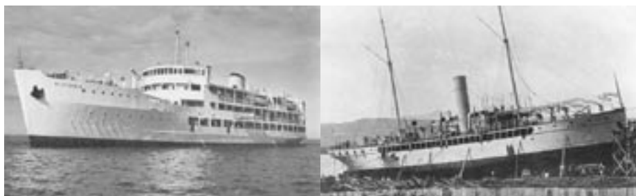
RMS Victoria på Victoriasjön i Uganda, och SS Winifred på varvet i Kisumu, Kenya